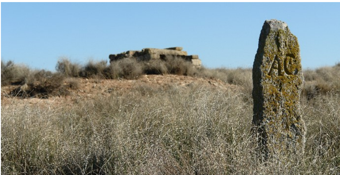
Fita que marca els límits del terme de Castellserà i Agramunt

A la Serra de Bellmunt-Almenara n'hi podem trobar gran nombre d'aquestes fites, en destaquen les més antigues, com la que delimita el terme de Castellserà i Agramunt on hi ha gravades les lletres AC.