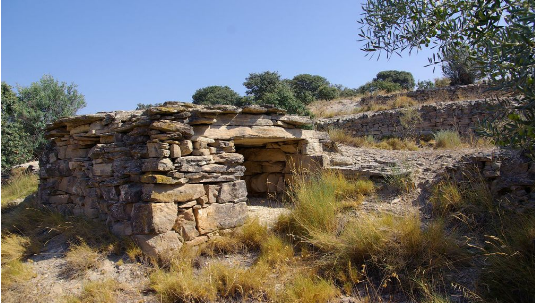
Aixopluc integrat al marge

També al llarg d'aquesta ruta es poden veure fites de terme, es tracten de blocs de pedra d'una sola peça amb les inicials dels noms dels pobles que delimiten gravades, aquesta lletra és a la cara de la pedra que està orientada cap al poble. La pedra està més, o menys tallada, en funció de la seva antiguitat.